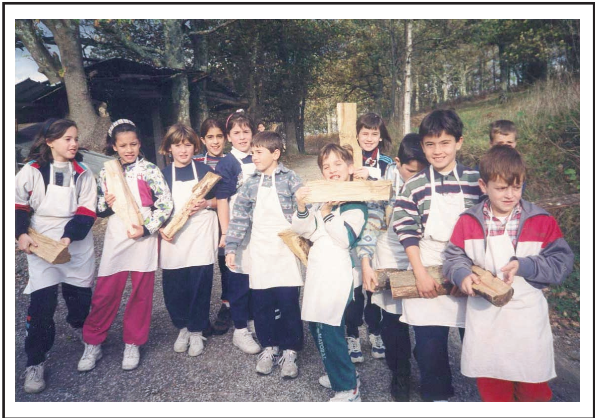
1986an jaiotakoak, Ezkio-Itsasoko Aristizabal baserrian. Ogia labean sartu aurretik, egurra biltzen.