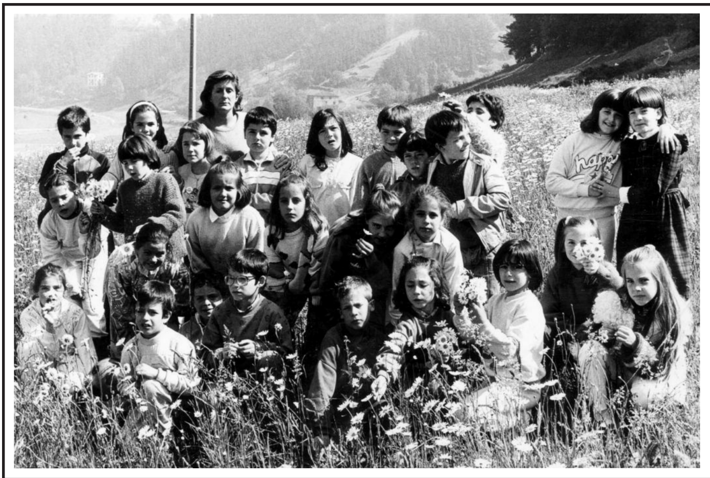
1978an jaiotakoak ikastola ondoko zelaietan.