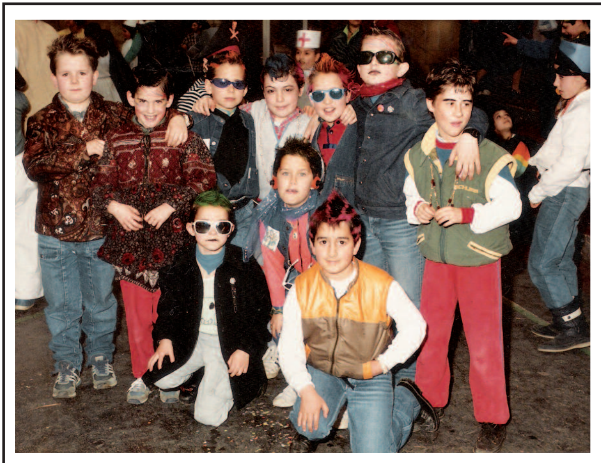
1987. urteko inauteritako argazkia