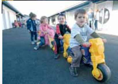
GAUR 222 IKASLE DITU HENDAIKO "GURE IKASTOLAK". IKASTOLA POLITA DA, BAINA TXIKIEGIA. IKASLEAK EZIN SARTURIK IRTENBIDEA BEHAR DUTE.