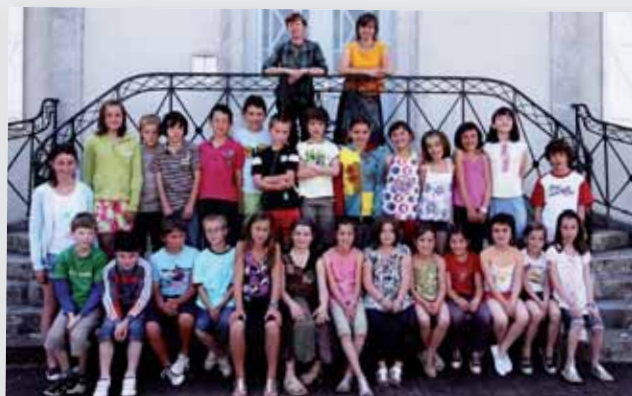
EPERRA IKASTOLAKO IKASLE GEHIENAK ZUBEROTARRAK DIRA. KANTU TXAPELKETAN PARTE HARTZEKOAK DIRA AURTEN. ETA DANTZAN ERE SAIAITUAK DIRA. HERRI TXIKIETAN KANTUA ZEIN DANTZA INDARTZEN ARI DIRELA ADIERAZI DIGUTE ELKARRIZKETAN.