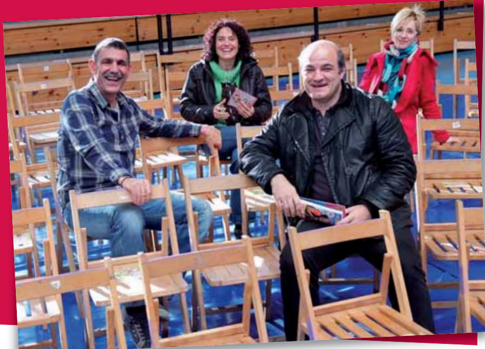
ELKARRIZKETA IBARRAKO POLIKIROLEGIAN EGIN ONDOREN. IDEA BAT OSO ARGI GELDITU ZEN: NORBANAKOAN GAINETIK PROIEKTU ESTRATEGIKOAK BEHAR DITUELA EUSKALGINTZAK.