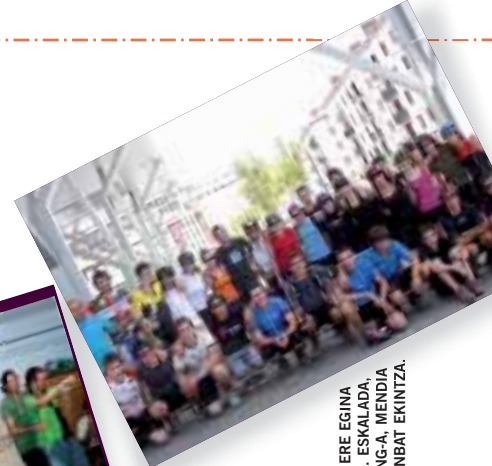
IPARRALDEKO BIRA ERE EGINA DUTE BIZIKLETAN. ESKALADA, ESPELEOLOGIA, RAFTING-A, MENDIA ETA BESTE HAINBAT EKINTZA.

Iaz 466 ikaslek hartu zuten parte udalekutan, bost urtekoekin hasi eta batxilergoekin bukatuz.