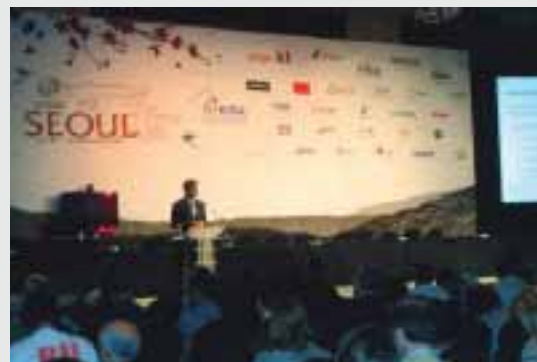
ARETO NAGUSIKO KONFERENTZIA-BILERA BAT.

izateko ez dago atxikimendu kopuru minimorik. Atxikimenduak EEKKren babesa adierazteko modu bat dira. .EUS proiektuak sei hilabetetan 25.000 atxikimendu inguru bildu dituen arren, ahalik eta gehien lortu behar ditugu. Bestalde, .CAT-en adibidean aipatu bezala, EEKKren babesa, bideragarritasun ekonomikoaren plana eta bideragarritasun teknikoaren plana egin behar ditugu. Horiek dokumentu batean bildu eta ebaluazio-kostea ordaindu beharko dugu. Kontua da, dokumentu horrek galdera zehatz batzuk biltzen dituela eta, galdera horiek erantzunez hiru arlo nagusi horiek landuko direla badakigun arren, egun ez dira behin betiko galderak ezagutzen. Alegia, ICANN, TLDak eskatzeko hurrengo aukera irekitzeko, dokumentu horren eta aplikatuko dituen politiken definizioan dago eta behin betiko dokumentua kaleratu arte, ez dugu .EUS domeinua eskatzeko aukerarik izango. Beraz, gutxi gorabeherako baldintzak ezagutzen