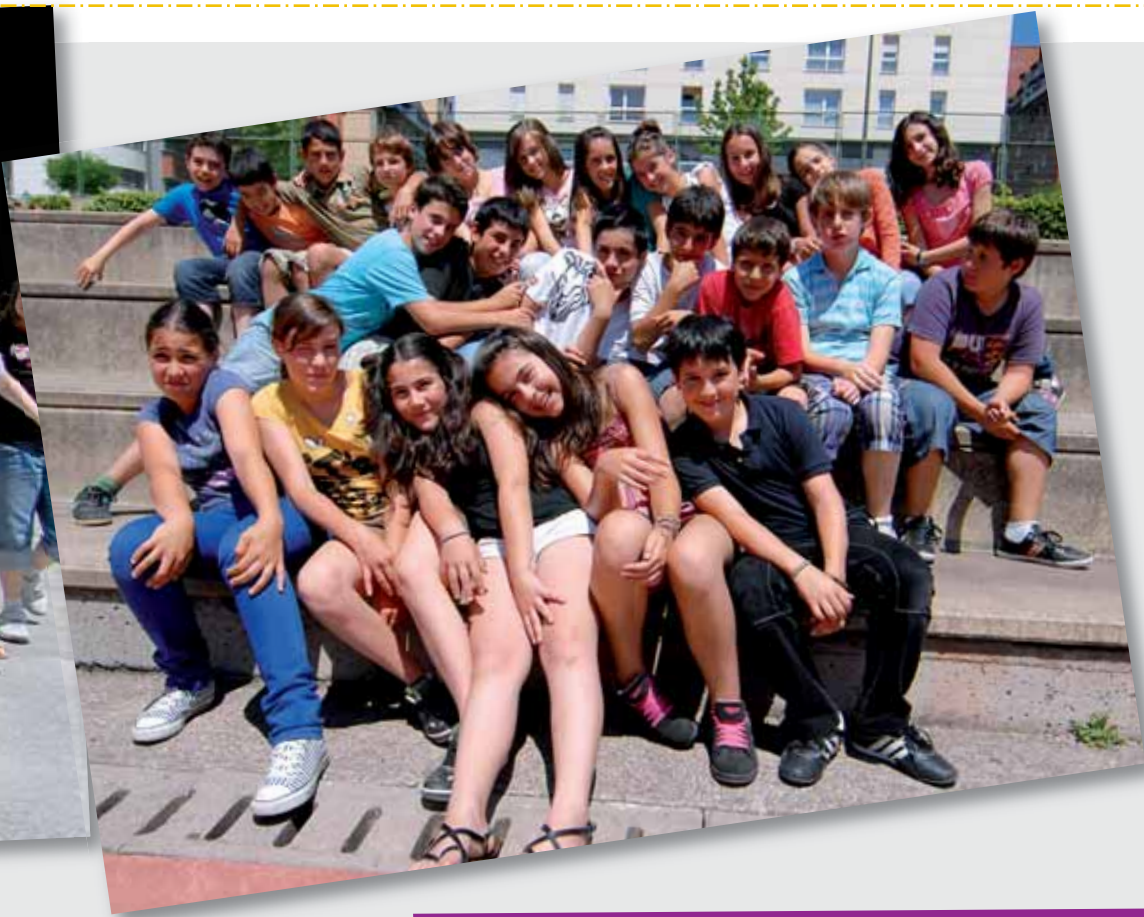
MAILA BAKOITZEKO IKASLEAK HIRU TALDETAN BANATZEN DIRA, ETA ARTE HEZKUNTZARI ASTERO DAGOKION ORDUJA ERABILTZEN DUJE TXANDAKA PLASTIKA, DRAMATIZAZIOA EDO MUSIKA LANTZEKO.

Ez da Arriaga bezain dotorea, baina antzezleku polita dute jangelan, agertoki eta guzti, eta Antzerki Gela bat ere badute entseguak egiteko. Gela zabal eta eroso da, eta armairuetan gordetzen dituzte arropak eta atrezzoak.