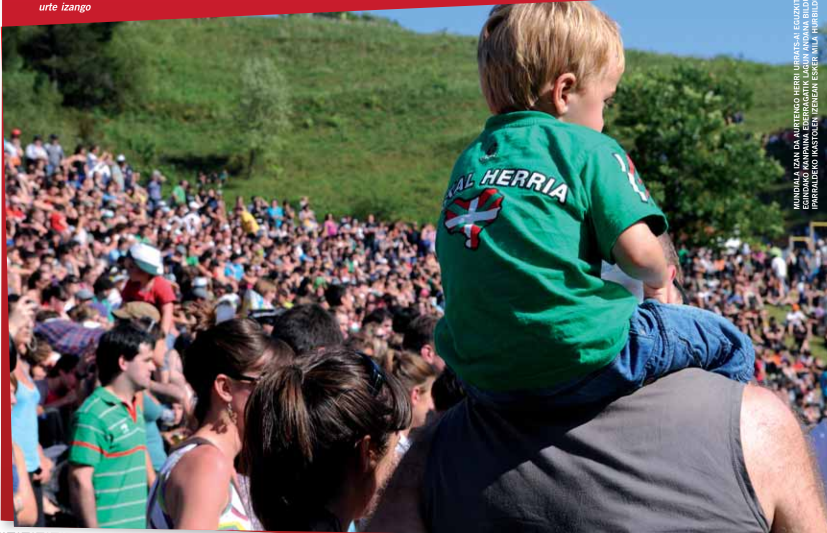
MUNDIALA IZAN DA AURTENGO HERRI URRATS-AT EGUZKITSUA IZANAGATIK ETA EGINDAKO KANPAINA EDERRAGATIK LAGUN ANDANA BILDU DA SENPEREN. IPARRALDEKO IKASTOLEN IZENEAN ESKER MILA HURBILDUTAKO GUZTIOI.

harreman estua lortu du Goierriko Iparraldearekin. "Era guztietako harremanak ditugu. Iparraldeko Hegoa topaketak oinarritzkoak izan dira harreman horretan. Topaketak hasi eta pare bat urtera