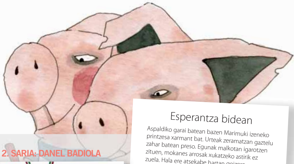
2. SARIA: DANEL BADIOLA