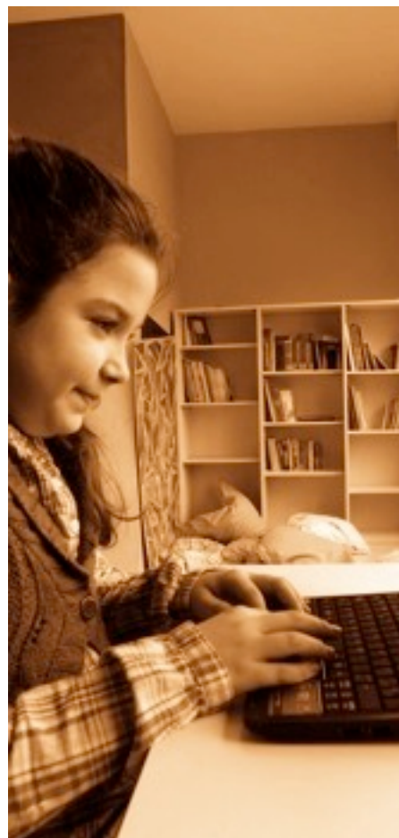
Ikastolari dagokionez, gestio arin eta gardena ziurtatu.

5.1. a) Ikastolaren funtzionamendu orokorrean sortzen diren beharrei erantzuteko zerbitzu egokiak eduki (jangela, garraioa, haur-zainketa, ...etab.).