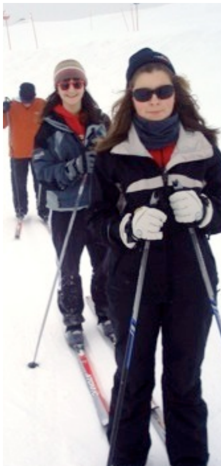
Euskararen normalizazioa eta zabalkuntzarako diren ekintzetan parte hartu.

3.11. a) Aukera erlijioso desberdinak inguru sozialean luketen garapena errespetatu.